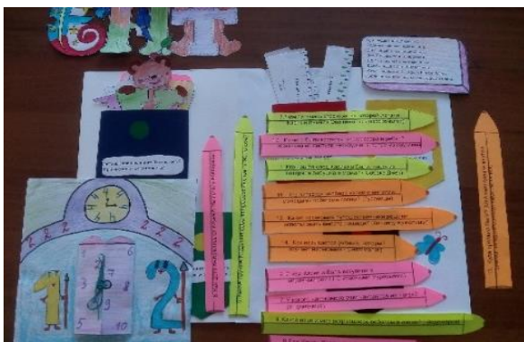
Папка Стрижковой Алёны 4 класс МКОУ СОШ с.Бур

Папка читателя содержала 5 различных заданий по не менее 5-ти прочитанным произведениям из Списка книг, рекомендуемых к прочтению.